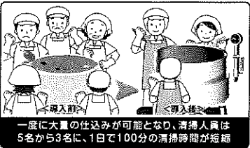
一度に大量の仕込みが可能となり、清掃人員は5名から3名に、1日で100分の清掃時間が短縮