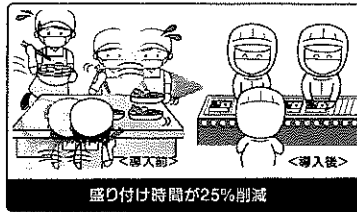
盛り付け時間が25%削減