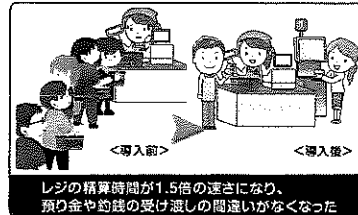
レジの精算時間が1.5倍の速さになり、預り金や釣銭の受け渡しの間違いがなくなった